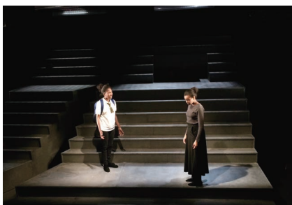
SSのレベル微調整と弱めの前明かり