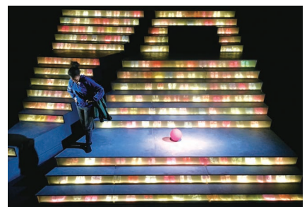
クライマックス「女の子は、次の世代も、次の次の世代も(犠牲になる)」の台詞で現れる靴